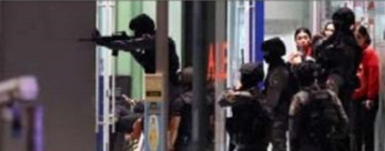
Security forces enter a shopping mall as they chase the gunman

BANGKOK: A Thai soldier shot dead at least 20 people yesterday, posting messages on Facebook as he went on the rampage in a northeastern city where he was still holed up in a mall nearly 12 hours after he first struck, authorities said.