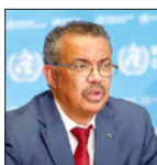
تقرير اأمرع خلال مؤتمر صحفي في جنيف، سويسرا.

شركات السياحة الجبروتية فتح انتشار الفيروس العالمي، وتعمل على إخراج السياح من الحجر الصحي. جاء ذلك بعدما ارتفع عدد المصابين بفيروس كورونا على مدى أسبوعين متتاليين، في الصين، حيث تم الإبلاغ عن 34 ألف إصابة و723 حالة وفاة في الصين في 23 كانون الثاني/يناير. وقال مسؤولون في منظمة الصحة العالمية، إن الفيروس انتشر في جميع أنحاء الصين، بما في ذلك مقاطعة هوبي، حيث نشأ المرض لأول مرة. وقال مسؤولو منظمة الصحة العالمية، إن الفيروس انتشر في جميع أنحاء الصين، بما في ذلك مقاطعة هوبي، حيث نشأ المرض لأول مرة. وقال مسؤولو منظمة الصحة العالمية، إن الفيروس انتشر في جميع أنحاء الصين، بما في ذلك مقاطعة هوبي، حيث نشأ المرض لأول مرة.