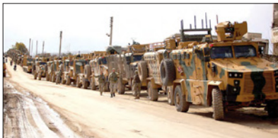
قافلة من الدبابات والجرافات العسكرية التركية تمر عبر سراقب في ادلب

مدينة تحرير الشام (جبهة التمسرة سابقاً) وصلات معارضة أخرى إلى قوتلوا. ويتبرأ هجوم قوات النظام على ريف ادلب الجنوبي والجنوبي الشرقي ويرافق حلب الجنوبي الغربي الحدودي، حيث يسير الطريق البري بأهـم 25 ألفي تـمـل مـيـتـة حـلـب بـمـعـاـلـمـه مع الطريق البري الذي يمر عبر حـلـب وحمص وسوياً إلى الحدود الجنوبية مع الأرنـ. وهي تسبق بـمـلـح في الوقت الراهن لاستعادة هذا الطريق شمالاً والتي سيبدأت على الجـد الأهم مع تـمـل مـيـتـة خلال هجمات عسكرية على طـر السـور التـمـسـر. وإفاد التلفزيون الرسمي السوري السبت أن وحدات من الجيش العربي السوري تمكن سيطرتها الكاملة على مدينة سراقب، في ريف ادلب الجنوبي الشرقي، حيث يسير الطريق ومع استمرار المعارك والغارات، حطفت قوات النظام أسس في معارك حلب.